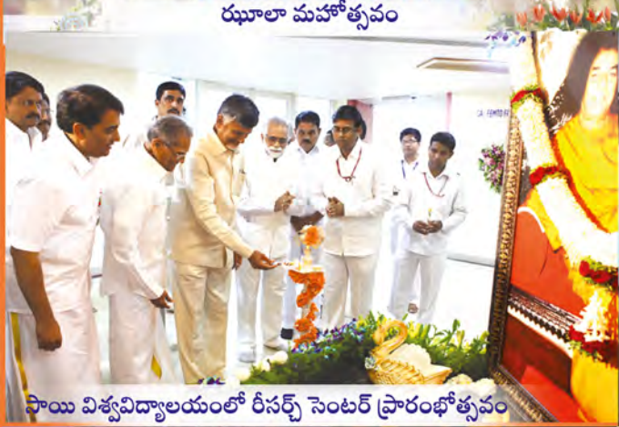
సాయి విశ్వవిద్యాలయంలో రీసర్చ్ సెంటర్ ప్రారంభోత్సవం