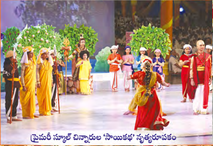
ఫ్రైమరీ స్కూల్ చిన్నారుల 'సాయికథ' నృత్యరూపకం