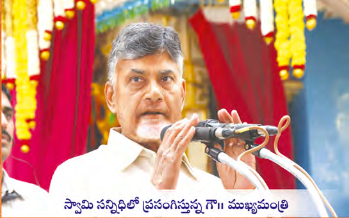
స్వామి సన్నిధిలో ప్రసంగిస్తున్న గౌ॥ ముఖ్యమంత్రి