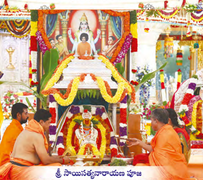
శ్రీ సాయిసత్యనారాయణ పూజ