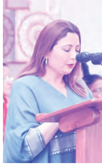
గౌ॥ విదేద్ బుషమయ్