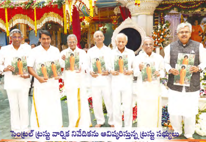
సెంట్రల్ బ్రహ్మ వార్షిక నివేదికను అవిష్కరిస్తున్న బ్రహ్మ సభ్యులు