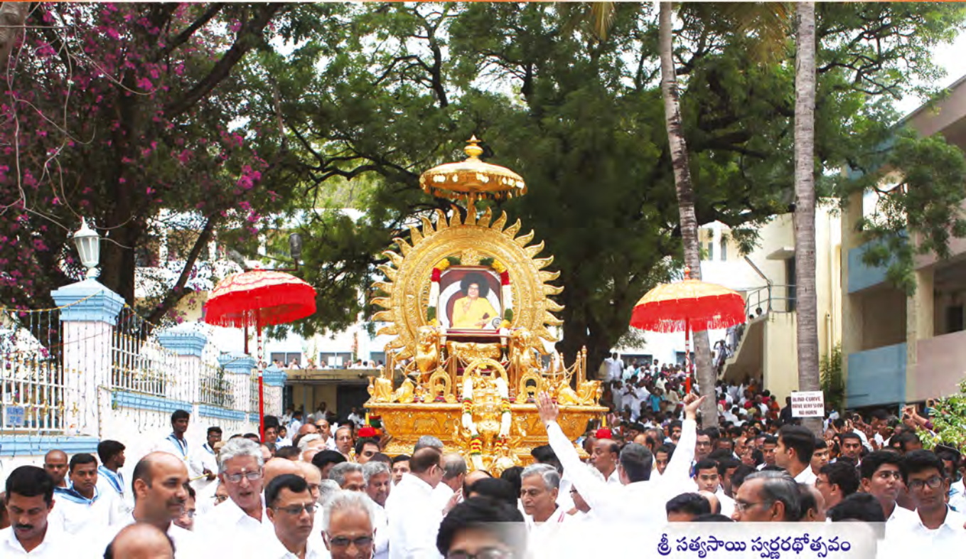
శ్రీ సత్యసాయి స్వర్ణరథోత్సవం