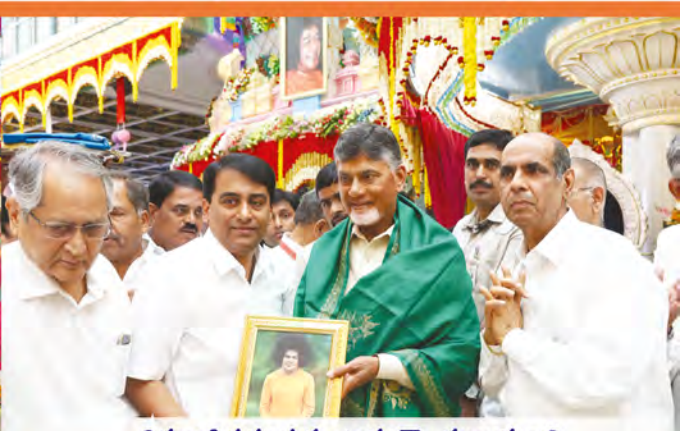
దివ్యజ్ఞాపిక సందుకుంటున్న గౌ॥ ముఖ్యమంత్రి