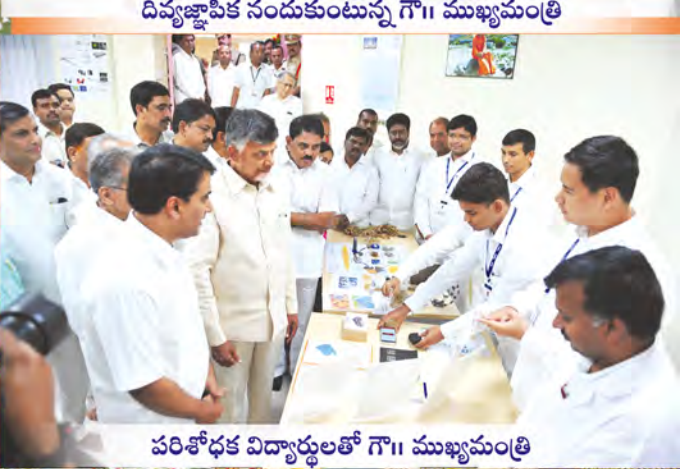
పరిశోధక విద్యార్థులతో గౌ॥ ముఖ్యమంత్రి