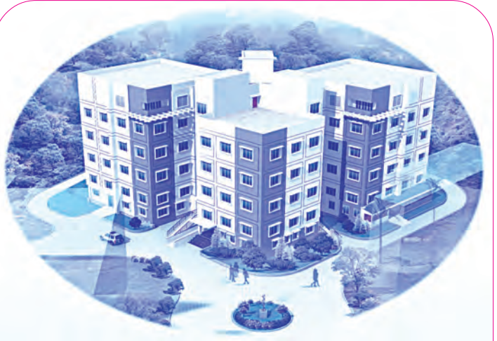
‘సెంట్రల్ రీసర్చ్ ఇన్ స్ట్రుమెంట్స్ ఫెసిలిటీ’ రేఖాచిత్రము

“శ్రద్ధ అనే భవాని ఎక్కడ ఉంటుందో అక్కడ విశ్వాసమనే శివుడు తాండవమాడుతాడు. శ్రద్ధ, విశ్వాసములే లేకుండిన జీవితమే శూన్యం. జగత్తంతయు ఈ రెండింటిపైనే ఆధారపడి యున్నది. శ్రద్ధ అనే భవాని, విశ్వాసమనే శంకరుడు అందరియందూ ఉన్నారు. ఈ ప్రకృతి అంతయు అర్ధనారీశ్వరత్వమే! మానవత్వంలో ఉన్న ఈ దివ్యత్వమును గుర్తించటానికి ప్రయత్నించాలి. ఇంతకంటే గొప్ప ఆధ్యాత్మికం మరొకటి లేదు.... భవాని - దేహతత్వము, శంకరుడు - ఆత్మతత్వము. భవానీశంకరుల సమ్మిళితస్వరూపమే మానవత్వం. ఈ రెండూ ఒకదానినొకటి అనుసరించియే ఉంటాయి. ఆత్మవిశ్వాసమే లేకుండిన ఎట్టి చిన్న కార్యమునైనా మీరు సాధించలేరు. కనుక మొట్టమొదట ఆత్మవిశ్వాసాన్ని పెంచుకోండి. అది ఉంటే ఈ జగత్తులో మీరు సాధించలేనిది ఏదీ లేదు. భగవంతుని తత్వాన్ని గుర్తించాలంటే మీరు గొప్ప