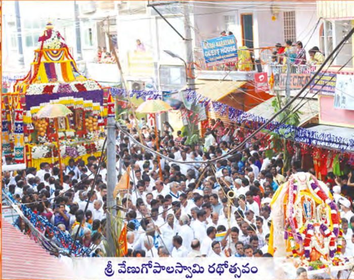
శ్రీ వేణుగోపాలస్వామి రథోత్సవం