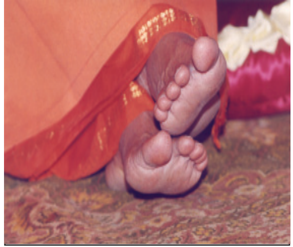
‘మానస భజరే గురుచరణం దుస్తర భవసాగర తరణం’

ఈ రోజును గురుపూర్ణిమ అని, వ్యాసపూర్ణిమ అని అనేక విధములుగా ఈ జగత్తునందు వ్యవహరిస్తున్నారు. పూర్ణిమ అనగా చంద్రుడు పూర్ణస్వరూపమును ధరించడం. అనగా, పవిత్రమైన మనస్సుయొక్క తత్త్వము పరిపూర్ణ స్థితిలో ఉండటమే! అనగా అభిమాన, మమకార, అహంకారములతో ఏమాత్రము సంబంధము లేనటువంటి