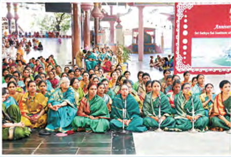
వైట్ ఫీల్డ్ హాస్పిటల్ 19వ వార్షికోత్సవం