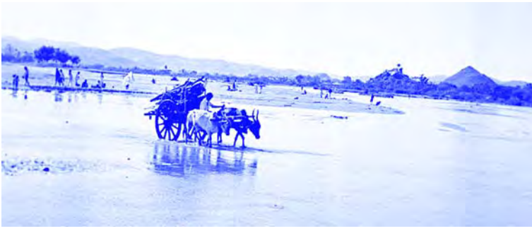
చిత్రావతీ నది (1950వ దశకంనాటి ఛాయాచిత్రము)

కట్టలతో, చర్నకోలతోనూ విపరీతంగా బాదుతూ ఉండేవారు. అంతేకాదు, ఆరోజుల్లో కోడిపందాలు కూడా జరిగేవి. అది చూసి తట్టుకోలేకపోయిన బాలసత్యసాయి అలా మూగజీవులను హింసించడం తగదంటూ తన నిరసనను తెలియజేశారు. “వేలెడంత లేని పిల్లవాడు ఎంతో కాలంగా జరుగుతూ వస్తున్న పందాలను అడ్డుకోవటం ఏమిట”ని ఊళ్ళో పెద్దల