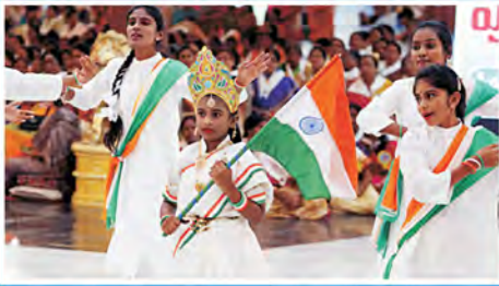
ఖమ్మం జిల్లా బాలల నృత్య కార్యక్రమం