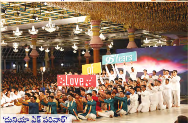
‘దునియా ఏక్ పరివార్’