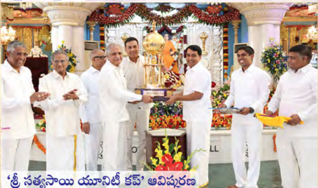
‘శ్రీ సత్యసాయి యూనిటీ కమ్’ ఆవిష్కరణ