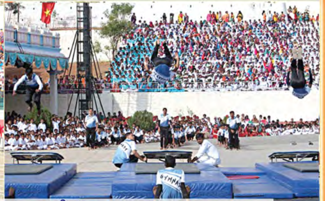
శ్రీ సత్యసాయి విద్యాలయాల వార్షిక సాంస్కృతిక క్రీడోత్సవం, 2020 జనవరి 11