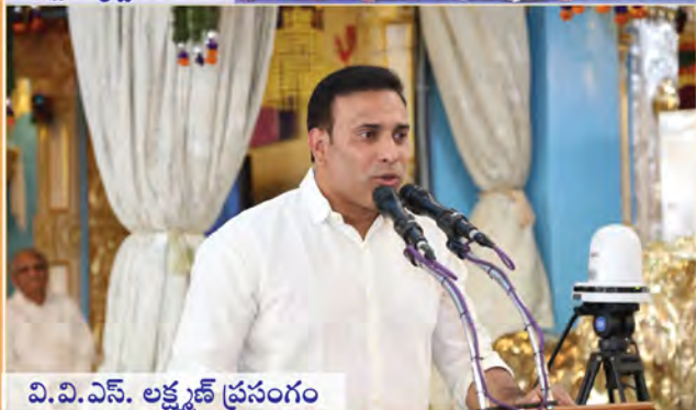
వి.వి.ఎస్. లక్ష్మణ్ ప్రసంగం