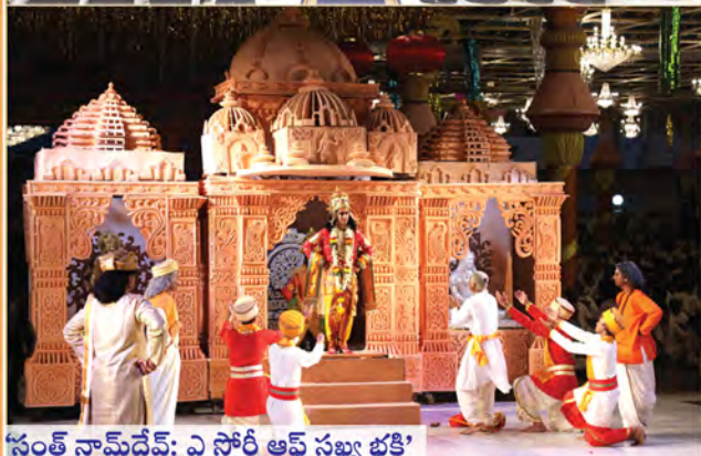
‘సంత్ నామ్ దేవ్: ఏ స్టోరీ ఆఫ్ సఖ్య భక్తి’