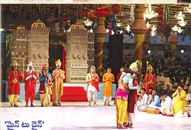
‘మైన్ టు డైన్’