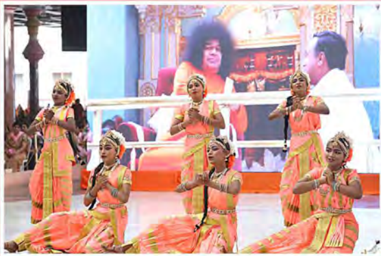
‘శీలమే విద్యకు పరమావధి’ - శ్రీకాకుళం బాలల కార్యక్రమం