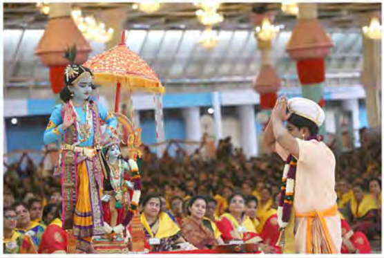
‘స్వర సాగరం’ - విశాఖ జిల్లా బాలల కార్యక్రమం