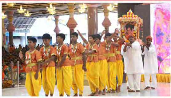
‘అభయదాయి శ్రీ సత్యసాయి’ - చిత్తూరు బాలల కార్యక్రమం