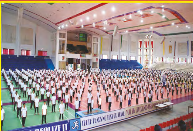
అంతర్జాతీయ యోగ దినోత్సవం