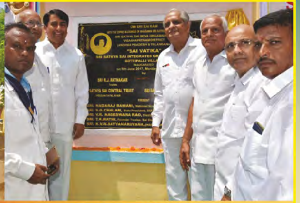
విశాఖ జిల్లాలోని గొట్టిపల్లి గ్రామంలో 'సాయి వాటిక' ప్రారంభోత్సవం