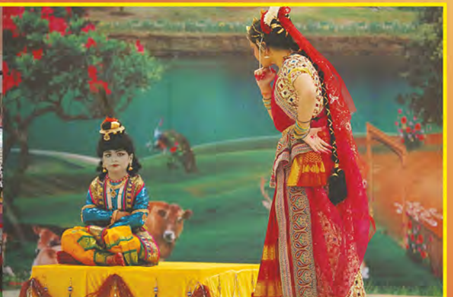
'కృష్ణం వందే జగద్గురుం'లో ఒక దృశ్యం