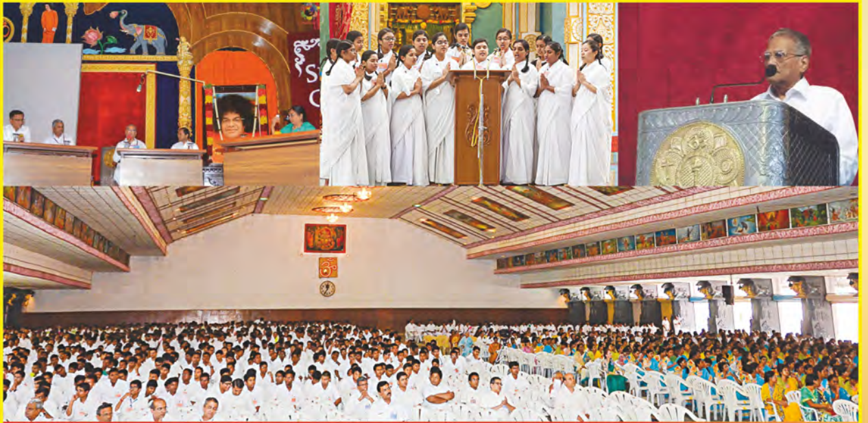
శ్రీ సత్యసాయి ఉన్నత విద్యాసంస్థ ఆధ్వర్యంలో వేసవి తరగతులు