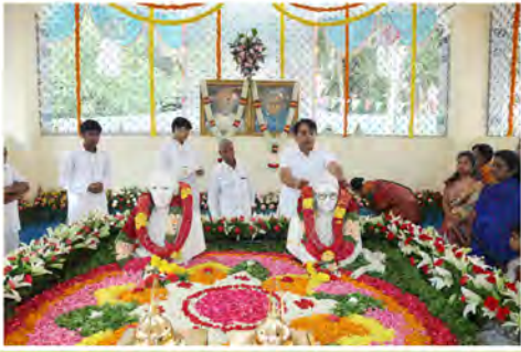
మాతృశ్రీ ఈశ్వరమ్మ సంస్కరణ దినోత్సవం