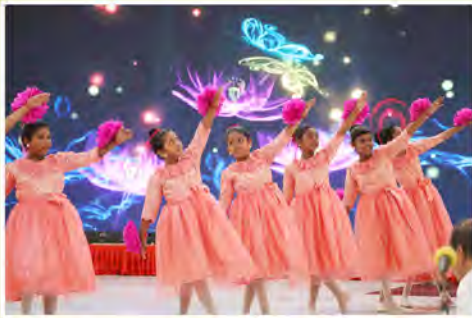
శ్రీలంక చిన్నారల నృత్య ప్రదర్శన