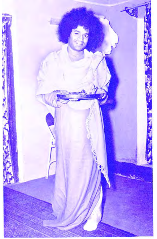
హస్తచాలనముచే అద్భుత సృష్టి

“జై బదరీ విశాల్” అనే ధ్వనులతో ఆలయము నుండి సదా కర్ణపేయంగా వినబడే నారాయణ భజన గేయములతో హృదయానందకరంగా ఉంటుంది. బదరీనాథ్‌లో ఇంచుమించు అందరిముఖాలపై పచ్చనిగంధంపై మెరిసే కుంకుమబొట్లు కనబడతాయి. బద్రిశుని ఆలయ సమీపములో ఉండే గుజరాతీ ధర్మశాలలో మాకు బస ఏర్పాటుచేసిరి. ఆలయ సమీపములో నిత్యమూ సంతోషముతో ఉరకలు వేస్తూ ప్రవహిస్తున్న తప్తకుండాలో (ఉష్ణోదకము) స్నానము చేసినాము. భోజనానంతరం శ్రీ స్వామి ఆనాటి సాయంకాలం అందరికీ దర్శనము ఇచ్చి వందనాలందుకున్నారు. పూజలు, అభిషేకాలు చేయించుకొమ్మని శ్రీ బాబా మాకు సెలవిచ్చారు. ఆ రాత్రి 9 గంటలకు గవర్నరు దంపతులచే బద్రిశునికి సహస్రనామ పూజ చేయించిరి.