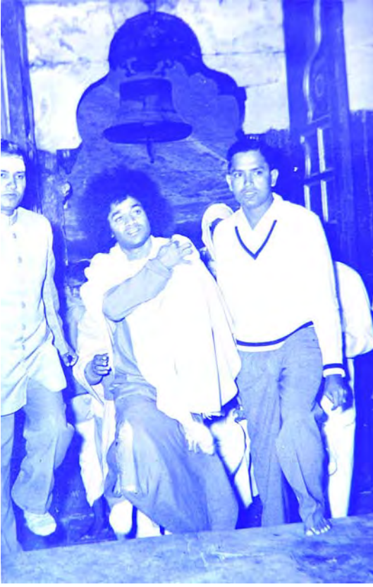
బద్రినాథ్ ఆలయంలో శ్రీ సాయినారాయణులు