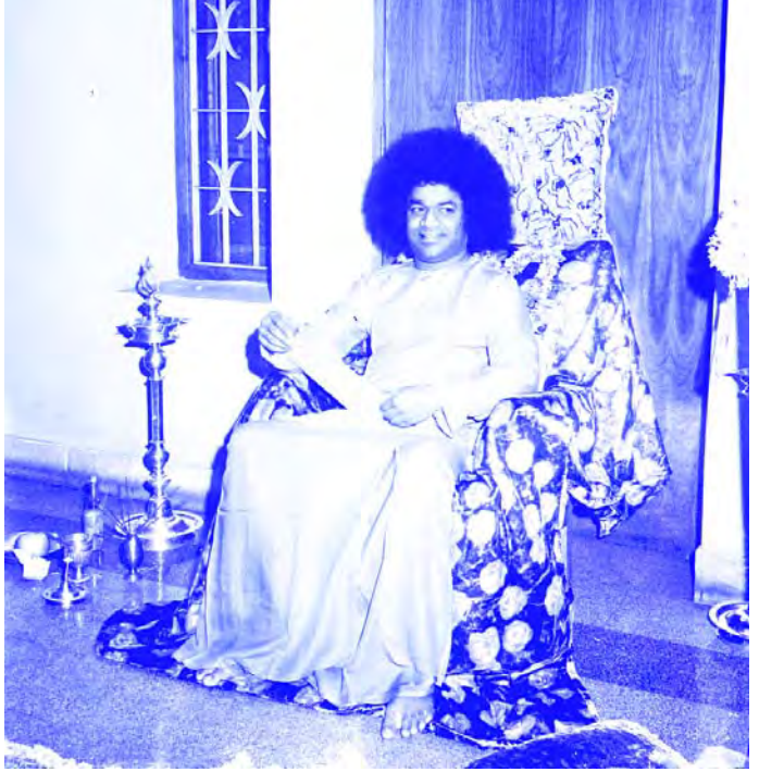
వెంకటగిరి రాజాగారి పూజామందిరంలో వరాలదేవుని దివ్యదర్శనం

భగవంతుడు ప్రతి యుగంలోనూ మానవోద్ధరణకై సంకల్పించుకుని అవతరిస్తూ ఉంటాడు. అయితే, మానవులలో ఆ అవగాహనారాహిత్యం, అవిశ్వాసం, ఊగిసలాట, అసలు భగవంతుడు ఉన్నాడా? అనే సంశయం, ఉన్నారని నమ్మేవాళ్ళలో చాలామంది భగవంతునితో ఇచ్చి పుచ్చుకునే వ్యాపార ధోరణిని ప్రదర్శించటం వంటి అనేక తామసిక లక్షణాలతో కొట్టుమిట్టాడుతూ ఉంటారు. అయితే, కన్నతల్లి ఎప్పటికప్పుడు తన బిడ్డల తప్పులను మన్నిస్తూ, మంచి చెడుల గురించి బోధిస్తూ, సన్మార్గవర్తనులుగా తీర్చిదిద్దటానికి, వారి జీవితాలలో వెలుగు నింపటానికి ప్రయత్నించినట్లు, మాత, పిత, గురువు అయిన దైవం కూడా తన దివ్యబోధలద్వారానూ, మహిమలద్వారానూ ప్రజలలో విశ్వాసాన్ని పాదుగొలిపి, వెలుగు నింపటానికి పూనుకుంటాడు. అటువంటిదే ఇప్పుడు మనం ప్రస్తావించుకోబోయే పాట. భగవాన్ బాబావారు ప్రజలకు పలికిన మేలుకొలుపు.