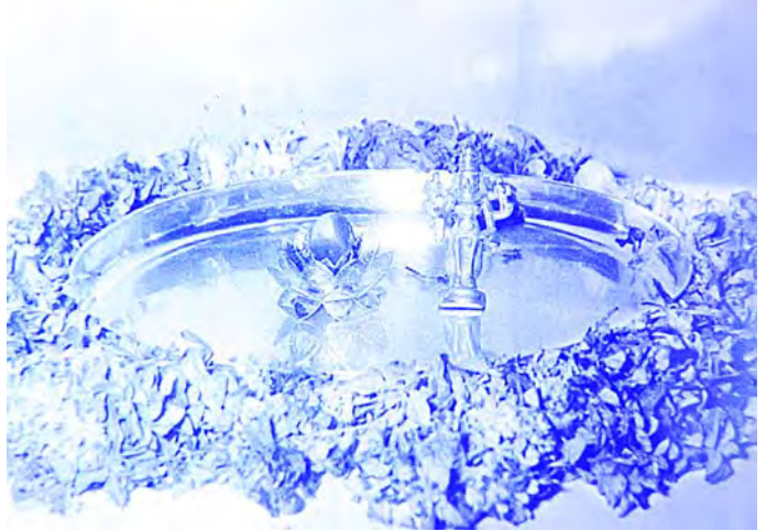
భగవాన్ సృష్టించిన సహస్ర దళ బంగారు పద్మము, నేత్ర లింగము, శ్రీమన్నారాయణమూర్తి విగ్రహం

అనుభవించినాము. వెంటనే మేమందరము బసకు వచ్చినాము. అక్కడ దేవాలయ అధికారులు, తదితర ఉన్నతోద్యోగులు అందరూ వచ్చినారు. ఆ దివ్య జ్యోతిర్నేత్ర లింగాన్ని శ్రీవారు ప్రతి ఒక్కరికీ చూపించి తమ హస్తకమలముతో గంగోత్రిజల పూరితమైన రజితధారాపాత్రను సృష్టించి, భక్తులందరిచేత స్పృశింపజేసి, రుద్రసూక్తము, పురుషసూక్తము, నారాయణోపనిషత్ పారాయణల నడుమ శ్రీవారు అభిషేకం చేసిరి. అభిషేకానంతరం 108 సువర్ణ బిల్వదళాలు, 108 తుమ్మిపూలు సృష్టించి భక్తులందరిచే స్పృశింపజేసి, అష్టోత్తర శతనామావళితో అందరి తరపున గవర్నరు