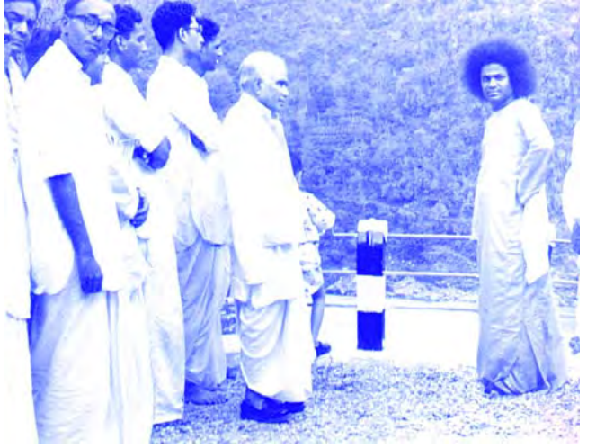
శ్రీవారి సన్నిధిలో శ్రీ బూర్గుల రామకృష్ణారావు తదితర భక్తబృందం

హరిద్వార్: 10వ తేదీ హరిద్వార్‌లో రైలు దిగి మార్కెట్ వచ్చిన బస్సులలో ఎక్కి అతి విశాలమైన ఋషికుల ఆయుర్వేద కాలేజీ భవనములో దిగినాము. ఆరోజు సాయంత్రము 6-30 గంటలకు ఉత్తరప్రదేశ్ గవర్నరు శ్రీ బూర్గుల రామకృష్ణారావు దంపతులు తదితర ఉన్నతోద్యోగులు, భక్తబృందం వెంటరాగా శ్రీవారు బ్రహ్మకుండం వద్దకు వేంచేసి గంగాపూజ హారతిని వీక్షించి, అందరికీ అమితానందము నొసగిరి. గంగాప్రవాహములో విడిచే మూడు దివ్యజ్యోతులను తిలకించితిమి. సత్వరజస్తమో గుణములను ఈ మాదిరి గంగలో వదలవలె నన్నట్లు హారతి జరిగినది.