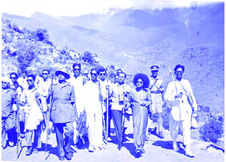
పర్వతమార్గమున పరీచుని వెంట....

బద్రీనాథ్ మార్గానందం: బదరీ నుండి వచ్చేవారు, బదరీకి పోయేవారు శతాధిక వృద్ధులు, తరుణ వయస్కులు, స్త్రీలు, పురుషులు, బాలురు, దేశదేశాలవారు “జై బదరీ విశాల్” అంటూ పయనిస్తూ ఉంటారు. ఆ ఇరుకు మార్గములో గోధుమలు, బియ్యం మోసుకొనిపోతూ ఉన్న వేలాది కొండగొర్రెలు! అడుగుపక్కకు వేస్తే అగాధములో పడిపోతామనే జ్ఞానంతో ఆచితూచి అడుగు జారకుండా అడుగులో అడుగువేస్తూ సామానులు మోసుకొని పోతూ ఉన్న వందలాది అశ్వములు! నడువలేక నడువలేక నడుస్తూ కొండపైకి మెల్లగా ఎగబ్రాకుతూ ఒకచోట కూర్చుని కొంతసేపు మార్గాయాసము