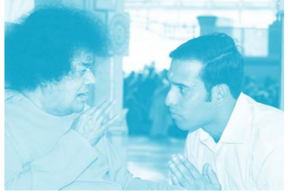
భగవాన్ సన్నిధిలో వి.వి.ఎస్. లక్ష్మణ్

క్రికెట్ ఒక్కటే కాదు, క్రీడలన్నికూడా జీవితానికి అవసరమైన ఎన్నో విషయాలను బోధిస్తాయి అంటారు భగవాన్. ఇక్కడ పుట్టపర్తిలో ఒక బ్రహ్మాండమైన