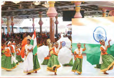
అదిలాబాద్ బాలల నృత్య ప్రదర్శన