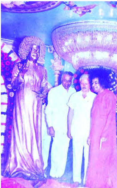
2002 జూలై 24 నాటి స్వామి విగ్రహావిష్కరణ దృశ్యం

ఆరోజు సాయంత్రం జిల్లా యువజనులు ప్రదర్శించిన "ఏకం సత్" నాటిక నిత్యసత్యమైన ఏకాత్మభావాన్ని చాటింది. భారతదేశ సంస్కృతీ వైభవాన్ని నేత్రపర్వముగా చిత్రీకరించింది. వేదాలు విశ్వజనీనమైనవనీ; భారతీయ