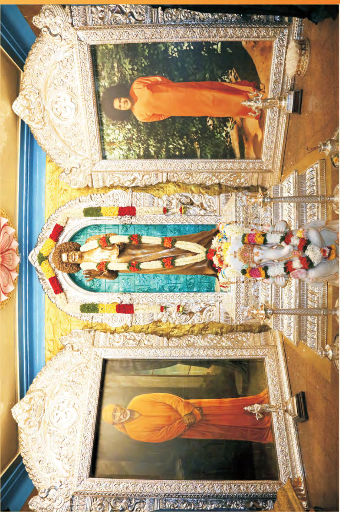
2020 మార్చి 5వ తేదీన ప్రశాంతి మందిరంలో పునఃప్రతిష్ఠాపమైన భగవాన్ శ్రీ సత్యసాయిబాబావారి దివ్యకాంస్యవిగ్రహము