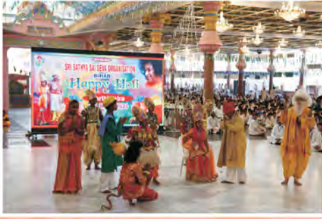
'భక్త సఖా భగవాన్'