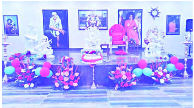
జమ్మూలో సాయి మందిరం