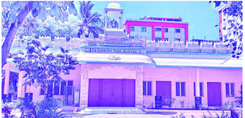
నేడు: శ్రీ పెద్ద వెంకటరాజు కళ్యాణ మంటపం

ప్రపంచవ్యాప్త భక్తజనావళి పుట్టపర్తికి భారులు తీరగా పాతమందిరంకూడా చాలకపోవడంతో 1950 నవంబరు 23వ తేదీన ‘ప్రశాంతినిలయం’ ఆవిర్భవించింది. అయితే, స్వామి అవతార ప్రకటన చేసిన తరువాత స్వామి దివ్యత్వం ప్రపంచానికి ప్రస్ఫుటం అవటానికి ప్రధాన వేదికై, అణువణువూ స్వామి పదస్పర్శతో, అద్భుత లీలలతో పునీతమైన పాతమందిరం గురించి భావితరాలకు గుర్తుండేలా ఓ మధుర స్మృతిని నెలకొల్పాలన్న భావం కలిగింది. అది పవిత్ర మంత్రోచ్ఛారణలతో, సుగంధ పరిమళ పుష్ప తోరణాలతో, మంగళవాద్యసమ్మేళనాలతో, దీపతోరణాలతో వెలుగు జిలుగులతో విరాజిల్లుతూ ఉండాలని సంకల్పించి సర్వ శుభలక్షణ సమన్వితమైన కళ్యాణమంటపాన్ని నిర్మించారు.