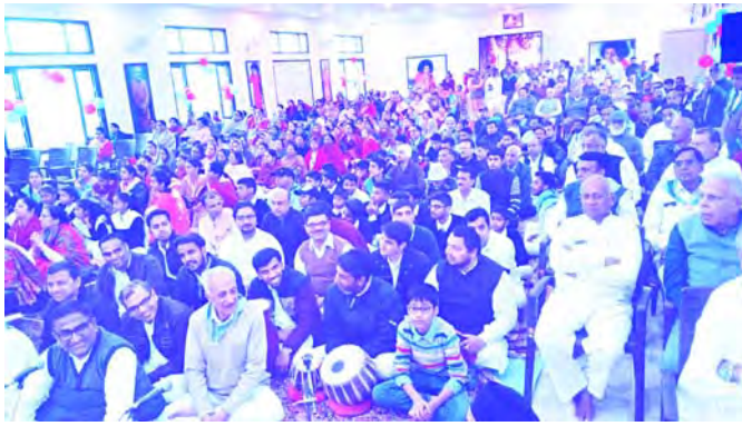
ప్రారంభోత్సవ కార్యక్రమంలో పాల్గొన్న భక్తులు

వివిధ వృత్తులలో శిక్షణ ఇవ్వడానికి ఈ కేంద్రం ఉపయోగ పడుతుంది. ఇక్కడి యువతీ యువకులను విద్రోహ శక్తుల ప్రభావమునుండి తప్పించి, వారిలో మానవతా విలువలను, దేశభక్తిని పెంపొందించడానికి ఈ మందిరము కృషి చేస్తుంది.