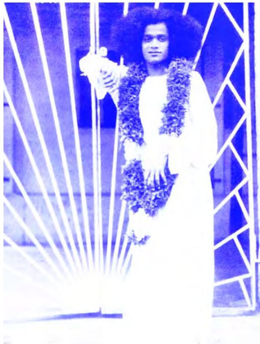
పాతమందిరం గ్రీల్ గేటు దగ్గర పర్తిశుని దివ్యదర్శనం

1948 ఉగాది ముందు, పాతమందిరంలో ఉండగా మహిళలు పూలదండలు గుచ్చుతున్నారు. అక్కడే ఉన్న స్వామి చటుక్కున లేచి వచ్చి, “అదిగో, గంగ వచ్చేస్తోంది, వచ్చి చూడండి” అని గేటు దగ్గరకెళ్ళి గేటు తలుపులు తీశారు. ఎదురుగుండా గంగా ప్రవాహం, ఉరకలు, పరుగులుగా సుళ్ళు తిరుగుతూ, నురగలు కక్కుతూ, భీకర శబ్దాలు చేస్తూ వస్తోంది. కనుచూపు మేరలో చెట్లు, ఇండ్లు ఏమీ కనబడటం లేదు. అందరూ భయభ్రాంతులై, “స్వామీ, స్వామీ,” అని అరుస్తూ స్వామి వెనుక నిలబడ్డారు. స్వామి రెండు చేతులూ జాపి ఆ ప్రవాహాన్ని అక్కడే ఆపి వారిని లోపల్నించి పూజాద్రవ్యాలు తెమ్మన్నారు. పసుపు, కుంకుమ, పూలు, కొబ్బరికాయలు తెచ్చి ఆ మహిళలు పూజచేసి నమస్కరించారు. ప్రవాహం స్వామి పాదాలను తాకుతూ అగిపోయింది. స్వామి, “చాలా సంతోషం. ఇంక వెళ్ళిరా” అనగానే ప్రవాహము వెనక్కి వెడుతూ వెడుతూ మాయమైపోయింది. తర్వాత చూస్తే ఎక్కడా ఒక్క బొట్టు నీరుకూడా కనబడలేదు. అప్పుడు స్వామి, “నా పాదాలవైపు చూడండి” అన్నట్లు సంజ్ఞ చేశారు. ఆశ్చర్యాతి ఆశ్చర్యం! గంగాదేవి వినప్రుతతో