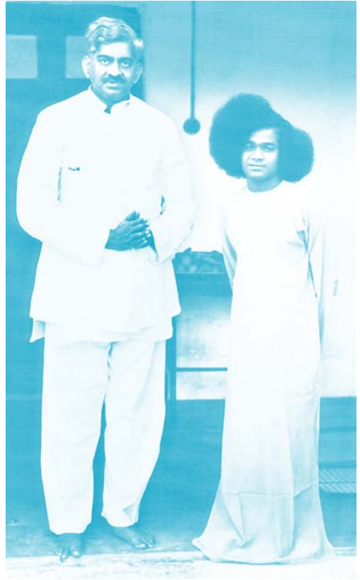
విశ్వవిభుని సన్నిధిలో వెంకటగిరి ప్రభువు

ఇప్పుడే రెండు దినముల క్రిందట, పూర్వము వారు అవతారము ఎత్తి సంచరించిన కాశీ, ప్రయాగ, అయోధ్య మొదలైన ప్రదేశములను సందర్శించి వారు వచ్చిరి. శ్రీ బాబావారితోకూడ ఆ క్షేత్రములకు పోయి దర్శించి వచ్చిన భక్తులందరూ అదృష్టవంతులు, పుణ్యవంతులు, ధన్యులు!