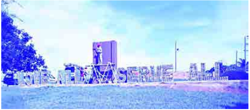
‘ఇకో బ్రిక్స్’తో సాయిసూక్తి - ‘లవ్ ఆల్, సర్వ్ ఆల్’

తయారు చేయటానికి తగిన సూచన లిచ్చింది. ఆ ప్రకారము శ్రీ సత్యసాయి కేంద్రముల సభ్యులు రెండు లీటర్ల ప్లాస్టిక్ సీసాలను ప్లాస్టిక్, పోలీస్టరిన్ వ్యర్థాలతో నింపి 400 నుండి 500 గ్రాముల వరకు బరువు ఉండే పర్యావరణహిత ఇటుకలను (ఇకో బ్రిక్స్) తయారు చేశారు. 'నేషనల్ గో గ్రీన్' బృందము సహకారముతో ఈ 'ఇకో బ్రిక్స్'ను