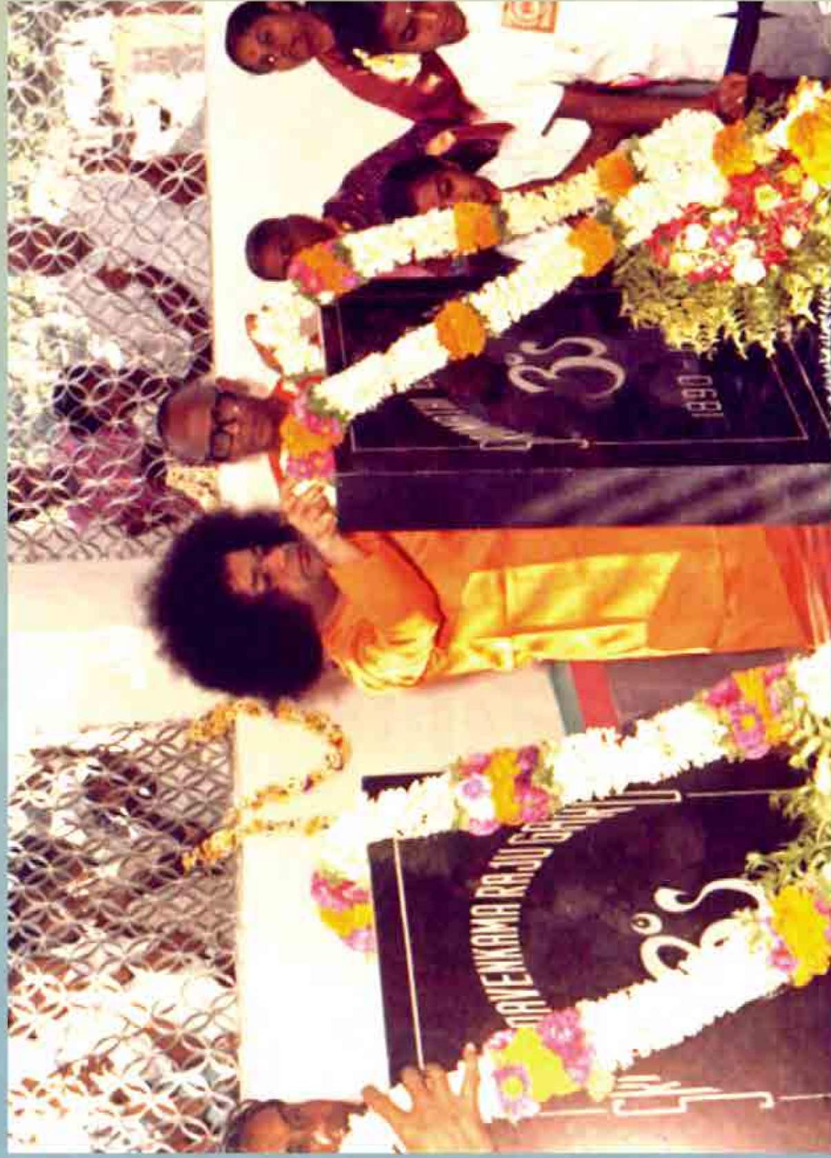
జననీ జనకుల సమాధి మందిరంలో శ్రీ సత్యసాయిశ్వురులు (1970వ దశకంలో)