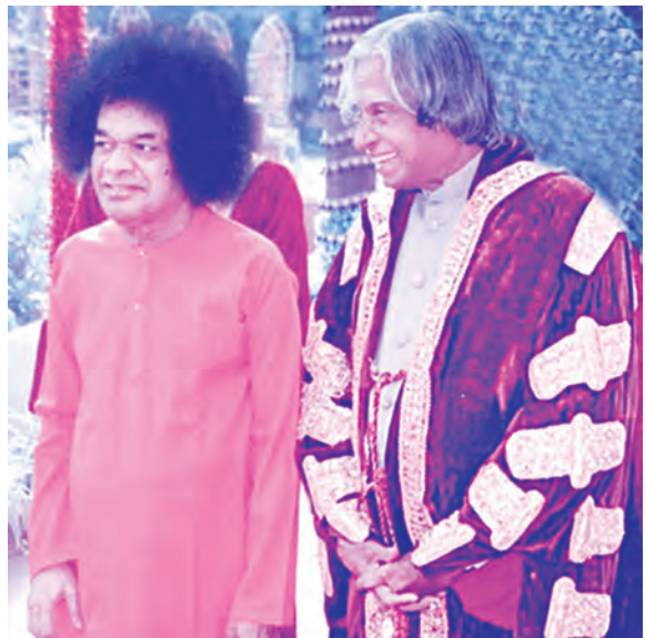
దివ్య ఛాన్సలర్ సన్నిధిలో డా॥ కలామ్

మానవ జీవిత లక్ష్యమేమిటనేది అతిసుందరంగా ఆవిష్కరించే సంఘటన మహాభారతంలో ఒకటైంది. శ్రీకృష్ణుడు అర్జునుడికి పరిమళాలను విరజిమ్ముతూ విరజూసిన పుష్పాలతో మధుపాలను ఆకర్షిస్తున్న బృందావనాన్ని చూపిస్తాడు. సమ్మోహనకరమైన ఆ