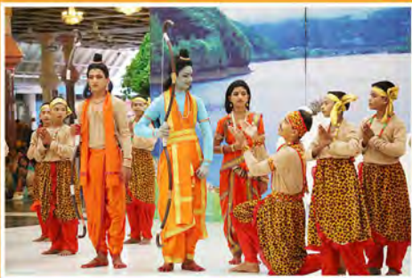
'రామకథారసర్పథి'లోని ఒక దృశ్యం