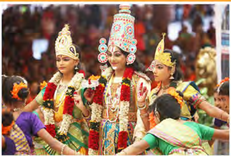
ఉమ్మడి మహబూబ్ నగర్ జిల్లా బాలల కార్యక్రమం