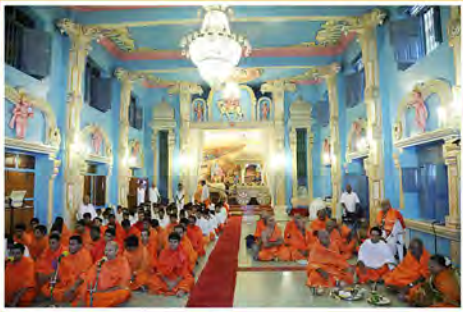
భజన హాలులో వేదపారాయణం